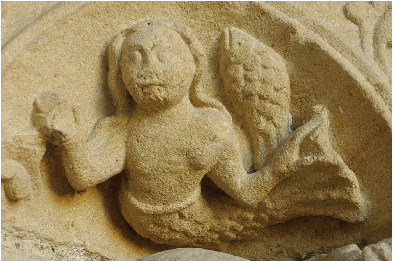
Sirène, relief du portail nord de la Collégiale Saint-Martin de Candès (Indres-et-Loire), XIII e siècle 4